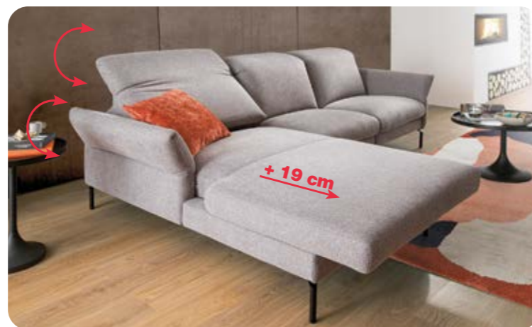
+ 19 cm