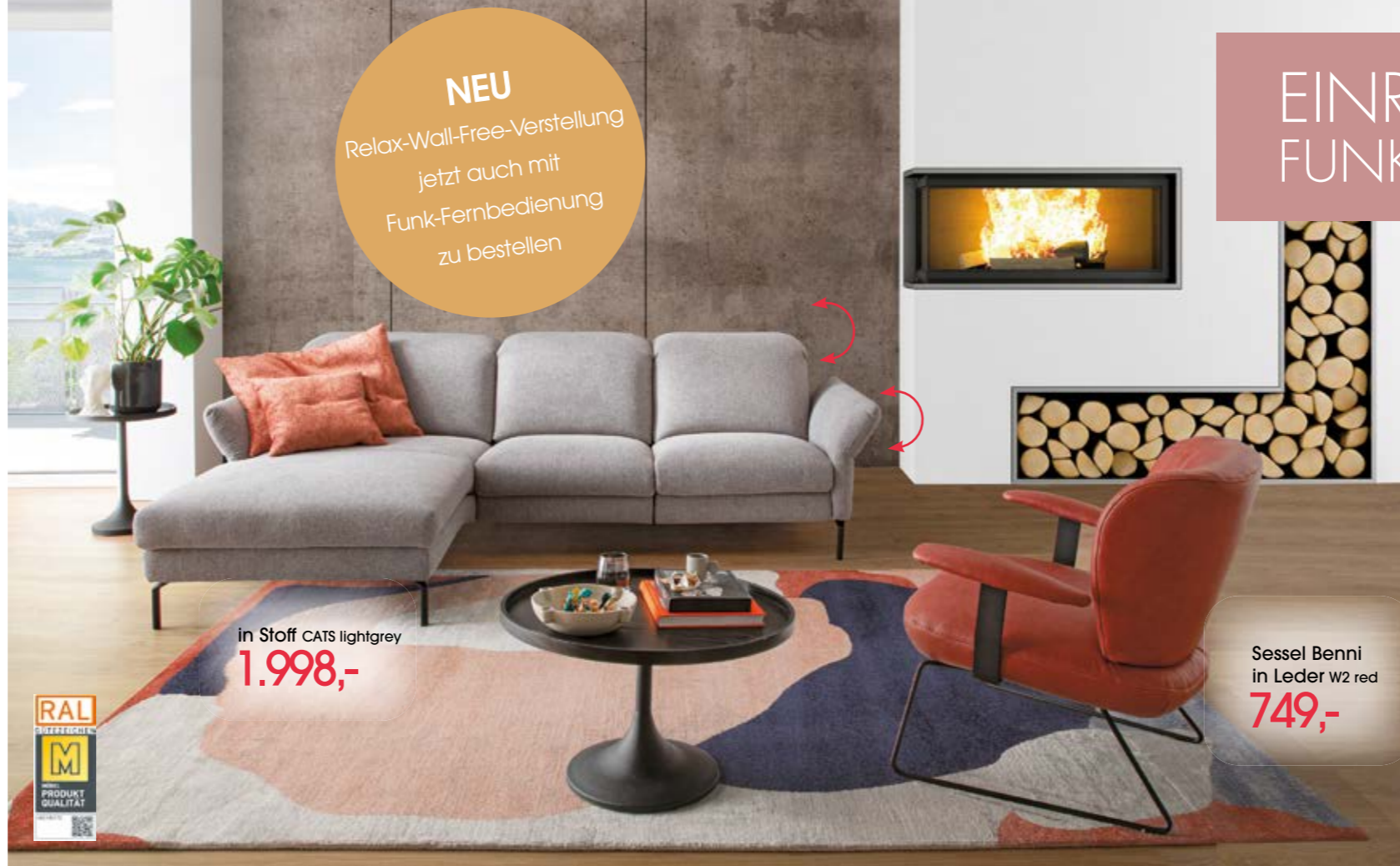
in Stoff CATS lightgrey 1.998,-

NEU Relax-Wall-Free-Verstellung jetzt auch mit Funk-Fernbedienung zu bestellen