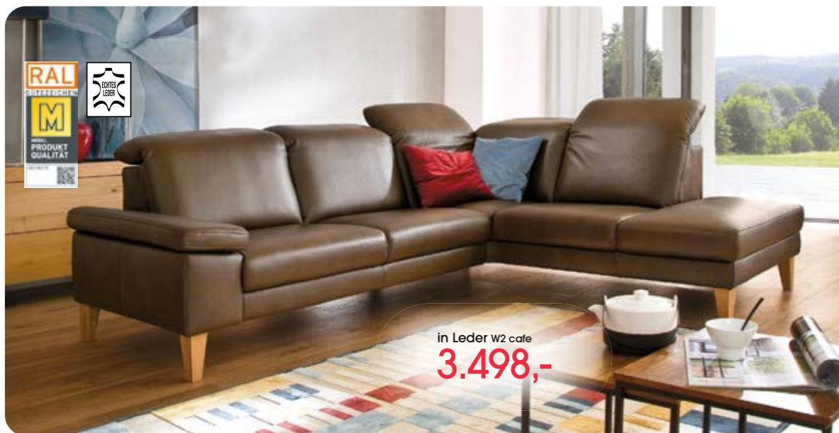
in Leder W2 cafe 3.498,-