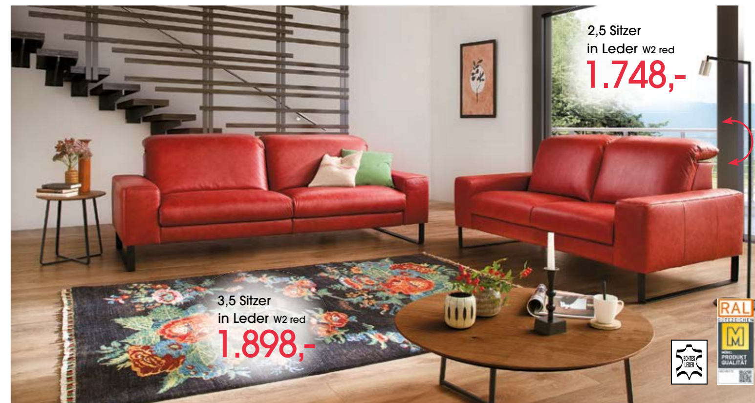
2,5 Sitz in Leder W2 red 1.748,-

Garnitur BENSON in Leder; Armlehne D; Metallkufe schwarz; inklusive Kopfteilverstellung; Kissen sind Deko Sofa 3,5 Sitz ca. 228 cm Sofa 2,5 Sitz ca. 188 cm