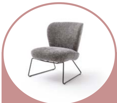
Retro-Sessel BENNI in Stoff; ca. 60 cm 529,-